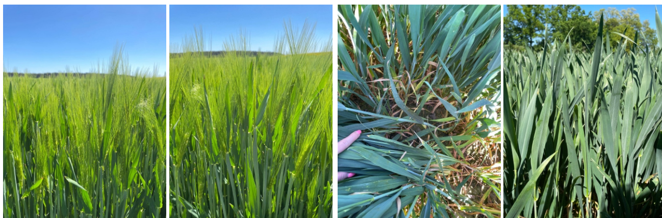
Fot. 1 i 2: Jęczmień ozimy Esprit

Jako ekonomiczne rozwiązanie fungicydowe polecamy Broteas 250 SC 1 l/ha .