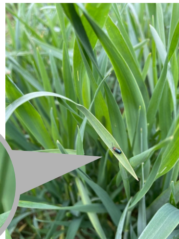
Fot.: Skrzypionka w pszenicy