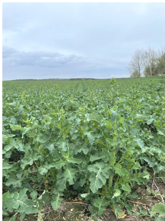
Fot.: Stodyszek w pąku