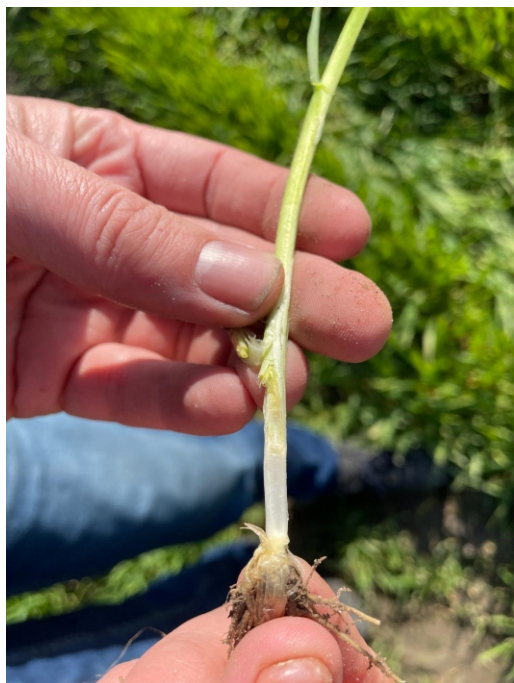
Fot.: Jęczmień jest już w idealnym momencie do regulacji i pierwszego zabiegu fungicydowego

Pszenice i pszenżyta nabierają wigoru. Weekendowe opady (od 20 do 35 mm) spowodowały, że rośliny zaciągnęły azot. W tym tygodniu planowane są zabiegi fungicydowe z regulatorami wzrostu w jęczmieniu. Zabiegi w pszenicach rolnicy powinni wykonać w przyszłym tygodniu.